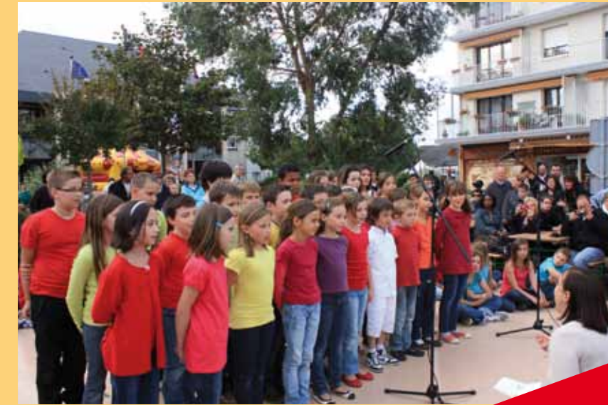
Ouverture de soirée avec les chorales de l'Ecole Hélène Boucher

De la musette au reggae, en passant par le rock, le jazz ou la chanson française, tous les styles de musique étaient présentés. Les Ballanais ne s'y sont pas trompés et étaient au rendez-vous. Une belle fête populaire !