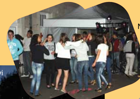
Nouveauté 2011 : l'espace Dancefloor animé par DJ Evan & DJ Enzo