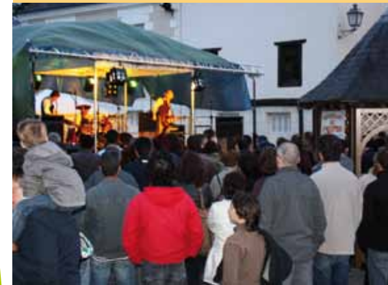
Ici la prestation très Rock'n'Roll de « Série Noire », face à un public nombreux.