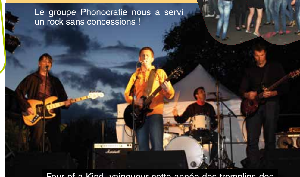
Le groupe Phonocratie nous a servi un rock sans concessions !