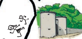
PORTES DE CHARLEMAGNE