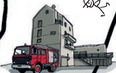
CENTRE DE FORMATION DU SDIS