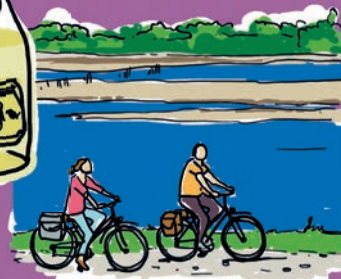
LA LOIRE À VÉLO