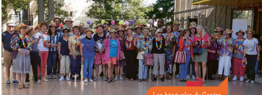
Les bénévoles du Centre Jules Verne