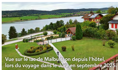
Vue sur le lac de Malbuisson depuis l'hôtel, lors du voyage dans le Jura en septembre 2025.