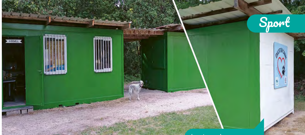
Les bungalows rénovés