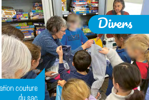
Opération couture du sac

En collaboration avec leur responsable, notre association a organisé 2 ateliers de fabrication de sacs à pain à partir de vieilles chemises. Avec grand plaisir, 20 enfants ont découpé et cousu à la machine leur sac avec l'intention de l'utiliser