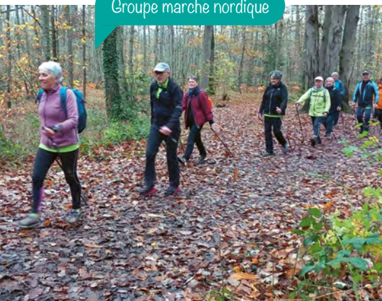
Groupe marche nordique

Les 2 e et 4 e mardi de chaque mois nous allons marcher à l'extérieur de la commune. Pour se déplacer, nous pratiquons le covoiturage entre participants ou avec les minibus prêtés par la ville. Ces mardis-là, une marche sur Ballan-Miré est toujours prévue.