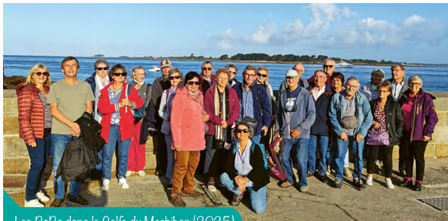
Les BaBa dans le Golfe du Morbihan (2025)