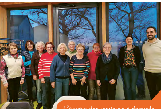
L'équipe des visiteurs à domicile

Sont concernées toutes les personnes de la commune, les personnes isolées, souffrant de solitude qui auront formulé la demande d'une compagnie de façon régulière.