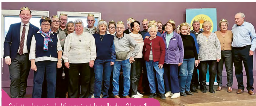
Galette des rois du 16 janvier à la salle des Charmilles

www.lesainesballanais.fr ainesballanais@gmail.com