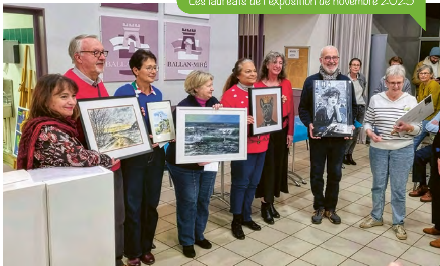
Les lauréats de l'exposition de novembre 2025